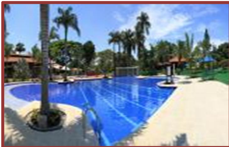
Club campestre de Promedico