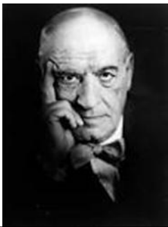
ORTEGA Y GASSET

Comenzaba la clase haciéndonos una breve reseña de un filósofo. Luego escribía sobre el tablero sus más importantes aportes a la filosofía... Debíamos analizar cada afirmación, y dar nuestros propios conceptos... Algunos filósofos eran muy difíciles de entender. A veces terminábamos afirmando todo lo contrario de lo que ellos querían expresar. No faltaba quien dijera alguna barrabasada... El príncipe no admitía sarcasmos. Insistía: toda afirmación, por absurda que parezca, tiene un valor.