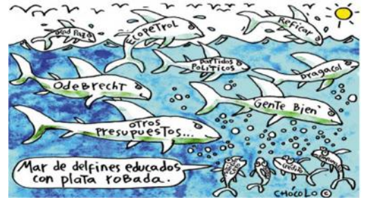
El mar de la corrupción según Chocolo

El Índice de Percepción de la Corrupción (IPC) del 2022 que Transparencia Internacional dio a conocer pone de manifiesto que la mayor parte del mundo sigue sin combatir de lleno la corrupción: el 95 % de los países solo han conseguido avances mínimos o nulos desde 2017. El IPC clasifica 180 países según las percepciones que estos tienen sobre el nivel de corrupción en el sector público, empleando una escala de cero (muy corrupto) a 100 (muy baja corrupción). Colombia ocupa el puesto 91 entre 180 países con un puntaje de 36/100 mientras que Dinamarca que es el primero en transparencia tiene un puntaje de 90.